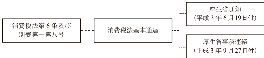
図1 助産に係る資産の譲渡等の法的概念図

から出産後2月以内に行われる母体の回復検診までに医師、助産師が行う資産の譲渡等が非課税 31 と説明される。